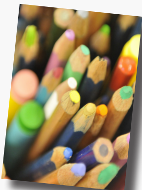
Bild och Form - om du älskar att måla, teckna och skulptera! Du tränar på att utveckla ett bildspråk, olika tekniker, arbetsprocesser och presentationer.